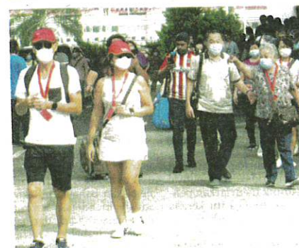
MALAYSIA masih mempunyai 27,328 kes aktif dengan kebolehjangkitan Covid-19.

Jumlah pesakit kes Covid-19 sedang dalam kuarantin wajib di rumah