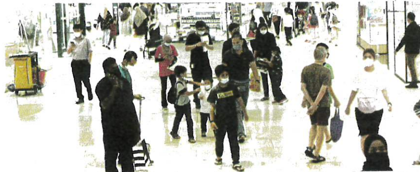
Kebanyakan orang ramai masih memilih untuk mengenakan pelitup muka terutama di kawasan tertutup ketika tinjauan di Putrajaya, semalam.

"Walaupun kerajaan tidak lagi mewajibkan pemakaian pelitup muka, saya masih memilih memakainya kerana mengelak risiko jangkitan, tambahan pula