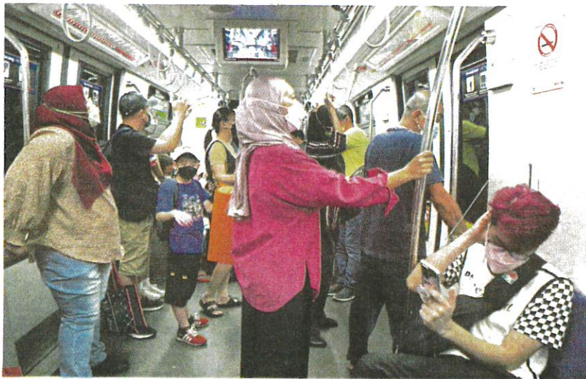
People must continue to wear face masks on public transport.