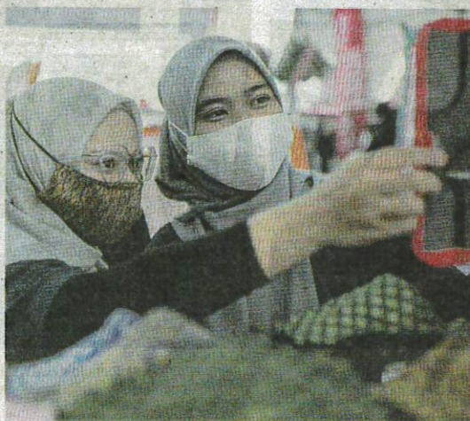
Walaupun tidak lagi diwajibkan, pengunjung premis tertutup amat digalakkan memakai pelitup muka.

"Kelonggaran yang diberikan ini bukanlah bermakna orang ramai boleh memandang ringan risiko