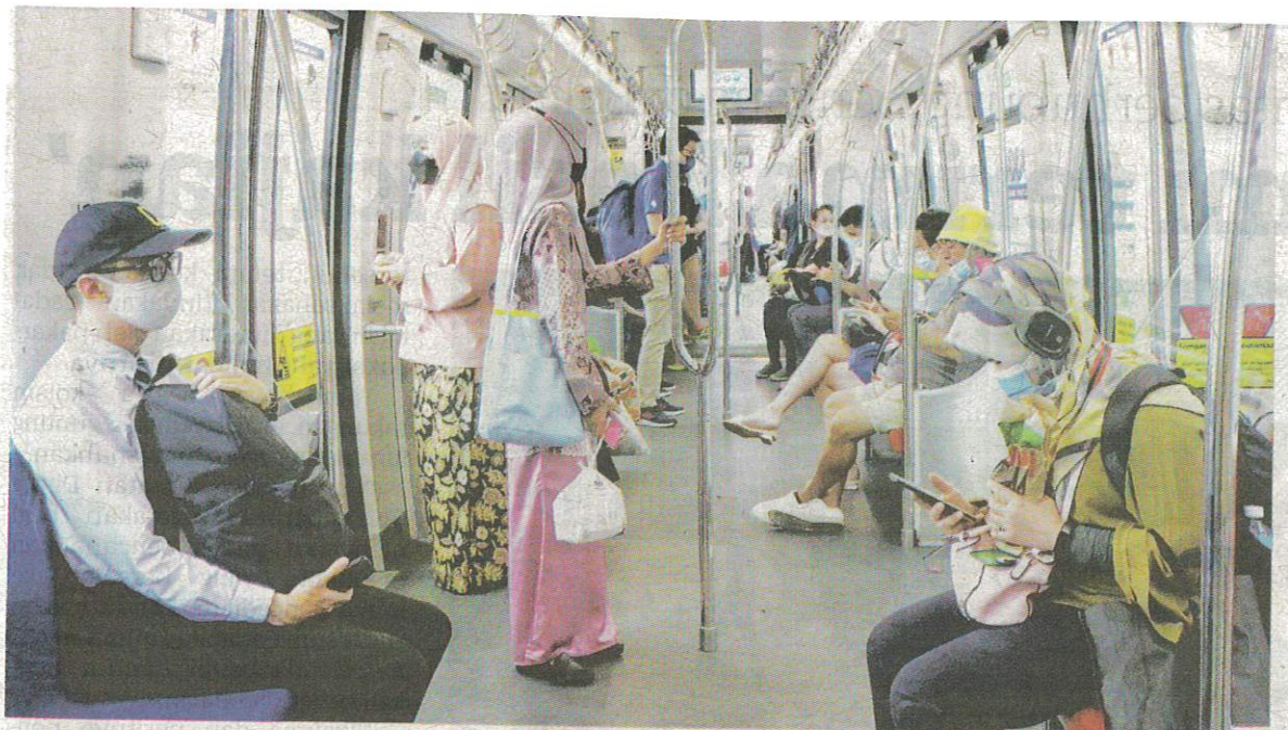
PEMAKAIAN pelitup muka di dalam pengangkutan awam dan fasiliti kesihatan masih lagi diwajibkan walaupun kelonggaran diberikan di dalam bangunan. – GAMBAR HIASAN