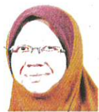
Pakar Perubatan Kesihatan Awam, Fakulti Perubatan dan Sains Kesihatan, Universiti Putra Malaysia (UPM)

● Kelonggaran SOP pencegahan wabak bukan bermakna kita lepas dan bebas daripada etika kemanusiaan serta penjagaan kesihatan