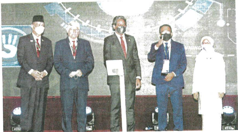
Khairy (tengah) merasmikan Persidangan Persatuan Perubatan Biosimilar dan Generik Antarabangsa yang turut dihadiri Dr Noor Hisham (kiri) di Kuala Lumpur, semalam.

"Dengan kelonggaran ini juga, orang ramai perlu memikul tanggungjawab individu yang lebih besar melindungi bukan sahaja